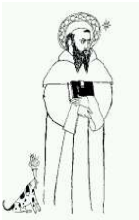
Fig. 1. Raffigurazione di un Santo (al momento) sconosciuto

Avendo dunque soddisfatto una regola di riconoscimento, Santi ha potuto