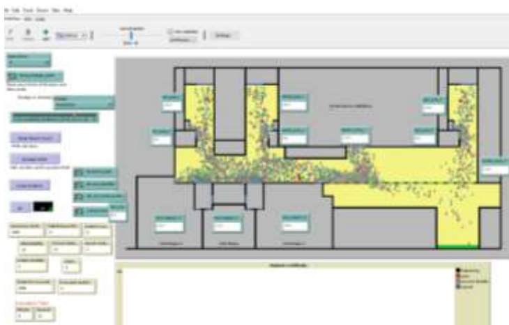
Fig. 5. Un'istantanea dell'interfaccia grafica di NetLogo durante l'esecuzione del modello di evacuazione di Palazzo Nuovo

In riferimento alla seconda direttrice di studi, come ricordato in precedenza, tra i vari strumenti a disposizione del Laboratorio Gallino è presente Pepper 13 , il social robot umanoide (Breazeal et al. 2016) progettato per essere un assistente alle persone, capace di comprendere e reagire alle principali emozioni umane. Con Pepper, in particolare, si sono iniziati a sviluppare alcuni progetti volti a esplorare le possibilità di interazione tra questo robot e i soggetti umani. Entro la cornice fornita dal software proprietario Choregraphe 14 , si sono progettate forme e