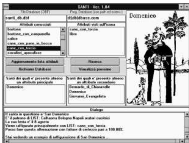
Fig. 2. Riconoscimento di un santo con il sistema esperto Santi

fare l'affermazione: "Il santo in questione è San Domenico".