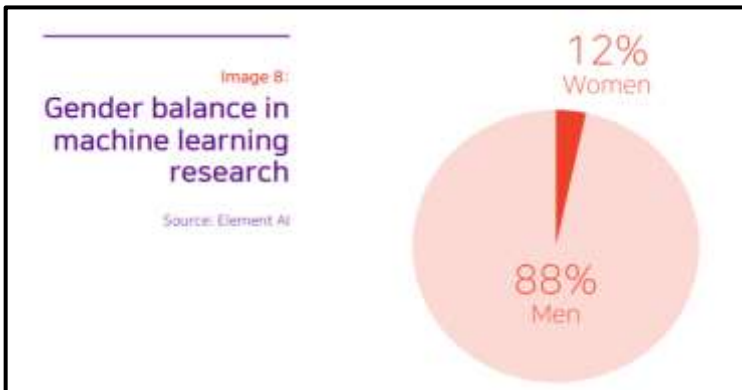
Graf. 1. Gender Balance in machine learning